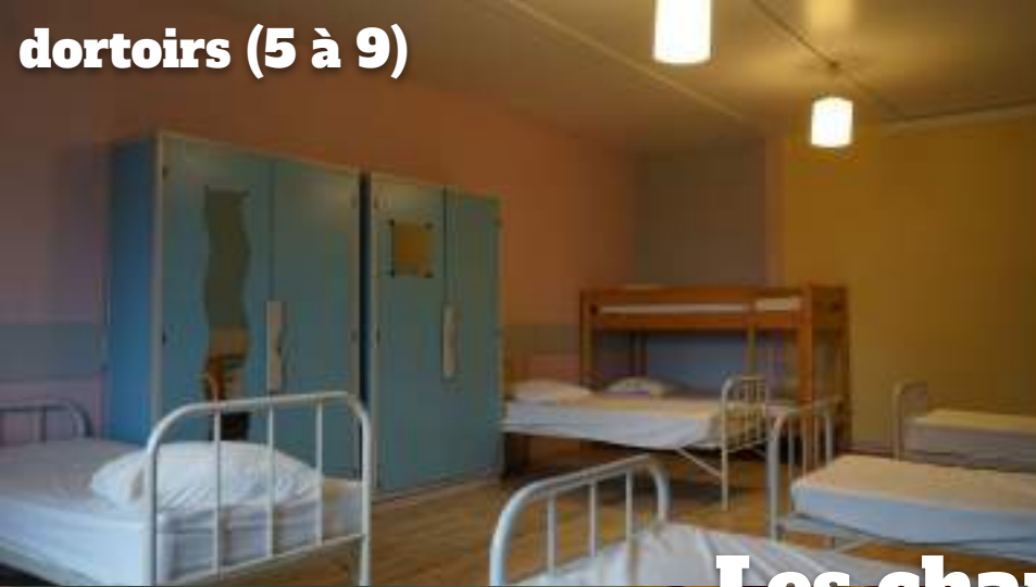
dortoirs (5 à 9)