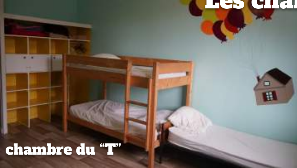
chambre du "T"